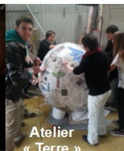
Atelier « Terre »